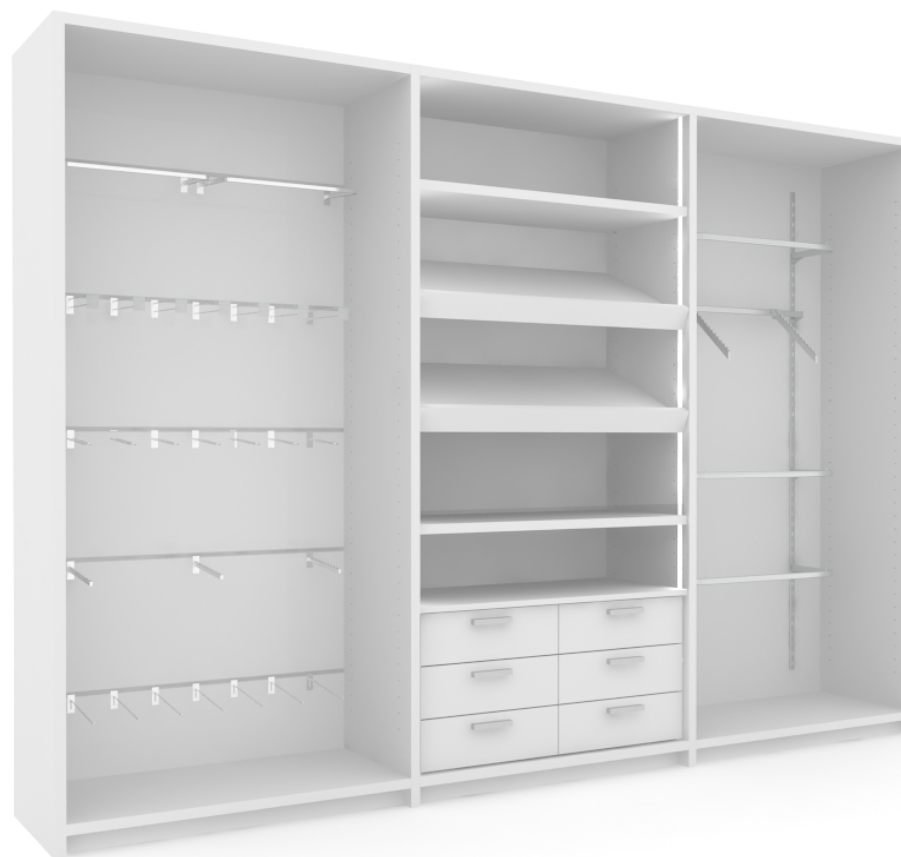
Imagen/Image Composición 01

dimensiones expositor (mm) display dimensions