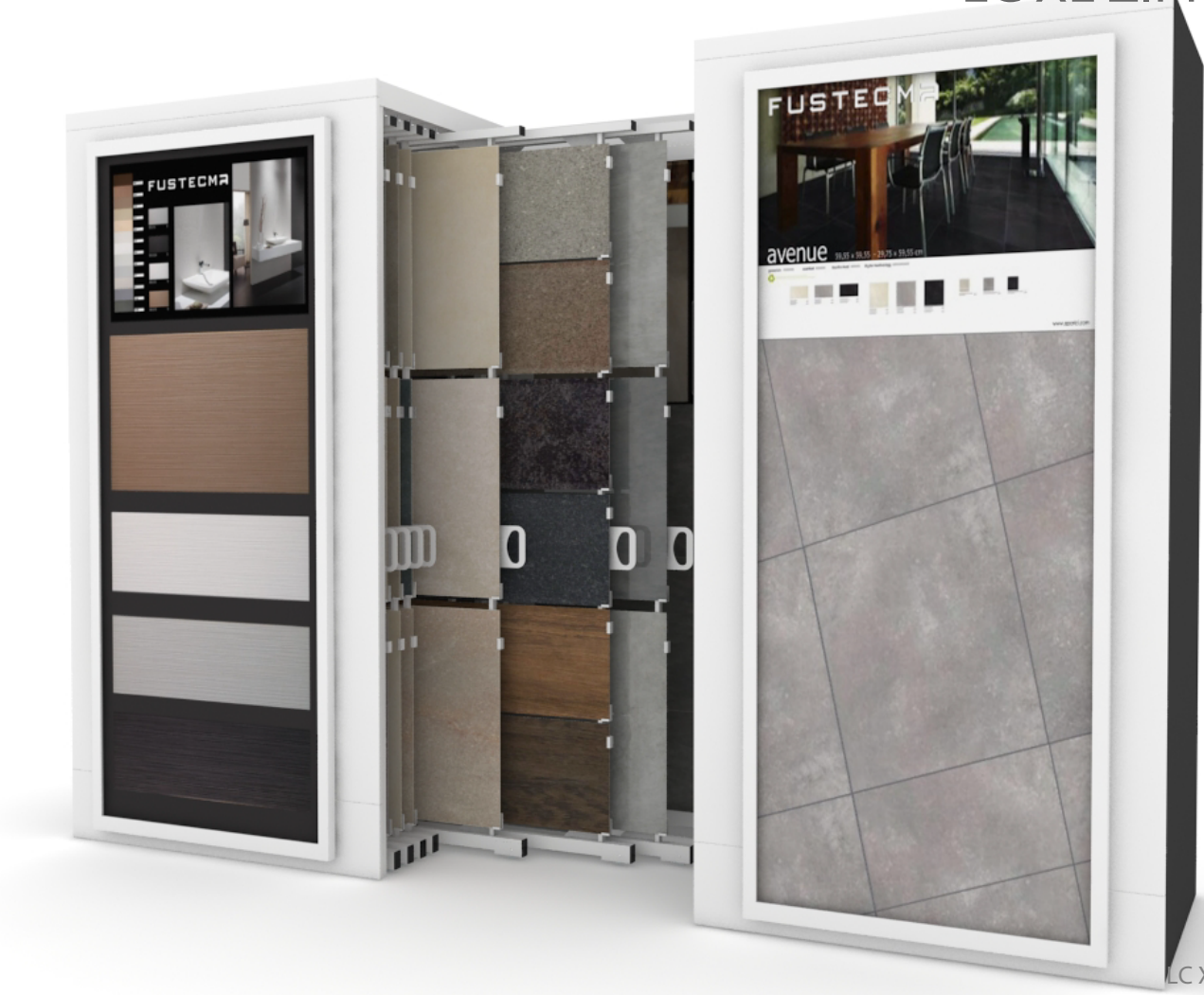
Imagen/Image LC XL ZIPPER DOBLE 20+1P